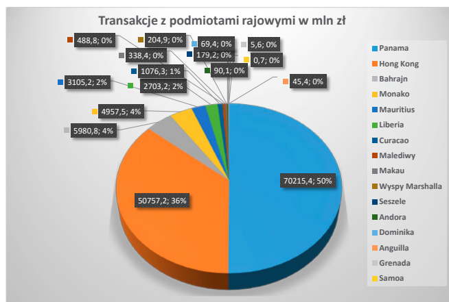
Rys. 3. Wartość transakcji z krajami (terytoriami) stosującymi szkodliwą konkurencję podatkową

Zaraportowane w TPR-C transakcje z podmiotami z krajów (terytoriów) stosujących szkodliwą konkurencję podatkową w zakresie podatku dochodowego 12 (tzw. rajów podatkowych) przedstawiono graficznie na rys. 3 13 według wstępnych danych Ministerstwa Finansów na dzień 30 czerwca 2021 r.