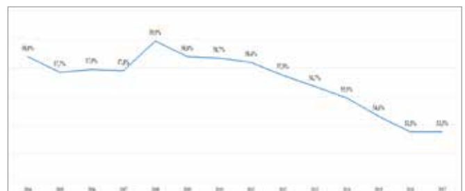
Wykres 6. Udział bazy VAT w PKB w latach 2004-2017 (Share of the VAT base in GDP in 2004-2017)

Źródło: Raport na temat wielkości luki podatkowej w podatku VAT w Polsce w latach 2004-2017... , op. cit.