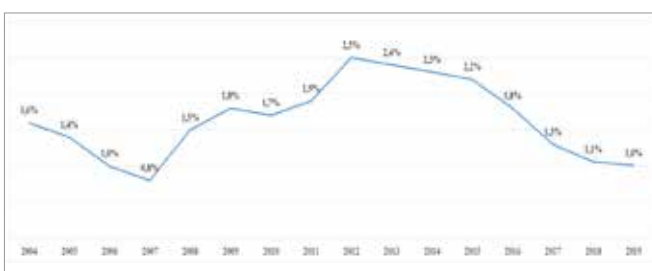
Wykres 5. Udział luki w VAT jako% PKB (Share of the VAT gap as% of GDP)