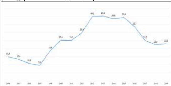
Wykres 4. Luka VAT w mld w latach 2004-2017 (VAT gap in billion in 2004-2017)

Źródło: Raport na temat wielkości luki podatkowej w podatku VAT w Polsce w latach 2004-2017 , Ministerstwo Finansów, Opracowania i analizy nr 3, Departament Polityki Makroekonomicznej, Departament Podatku od Towarów i Usług, Warszawa 2019; VAT Gap in the EU, Raport 2021, September 2021 , CASE – Center for Social and Economic Research (Project leader)